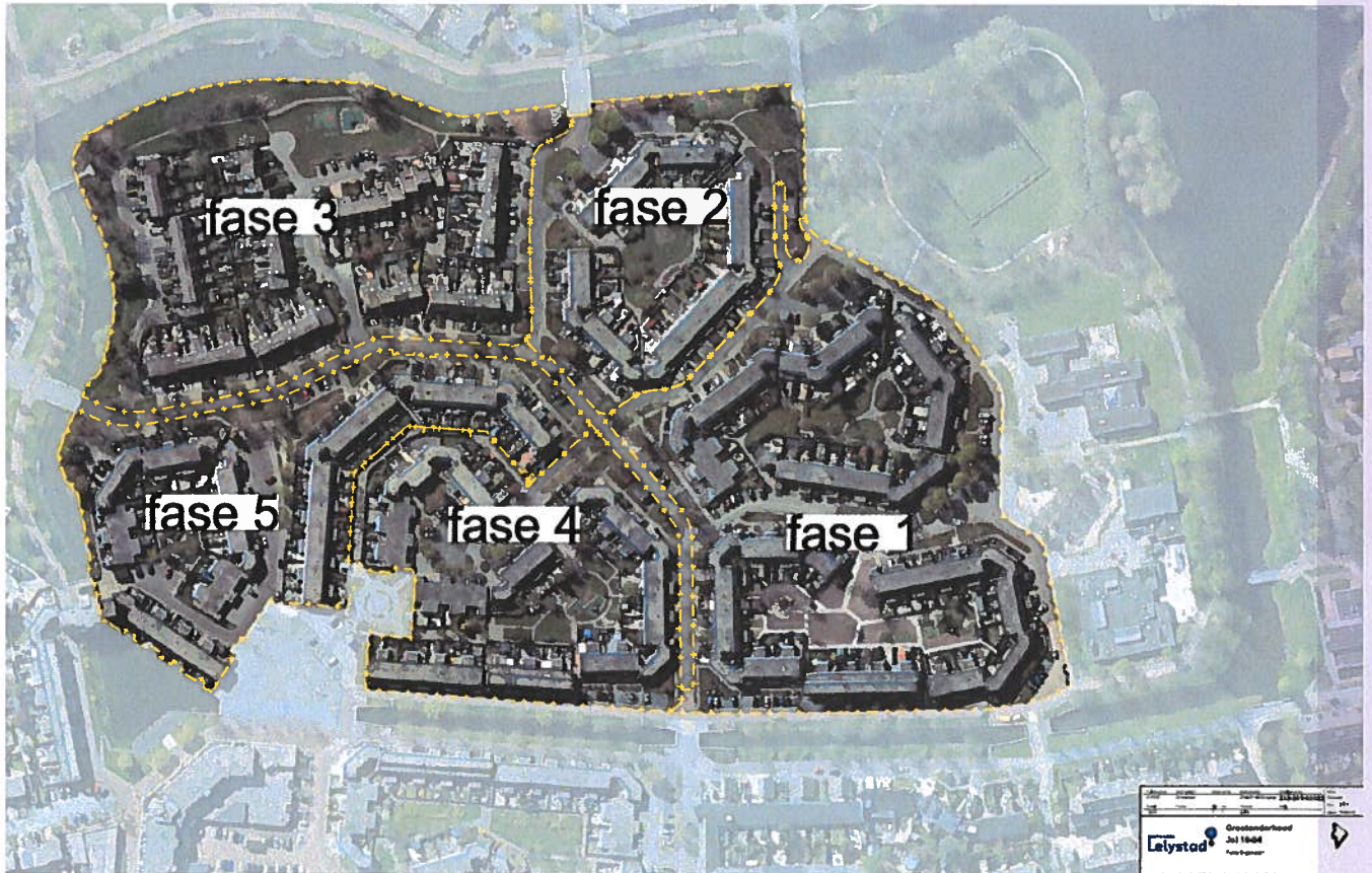
Plattegrond route groot onderhoud gemeente

Een aantal bewoners van verschillende hofjes hebben het initiatief genomen om het binnenhof anders in te richten. Hiervoor is een aanvraag bij Mensen Maken de Buurt ingediend. Woont u in een hofje waar het onderhoud nog wordt uitgevoerd? Dan kunt u samen met uw burens een plan indienen.